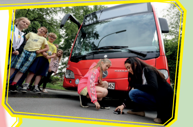
Vorsicht! Toter Winkel!