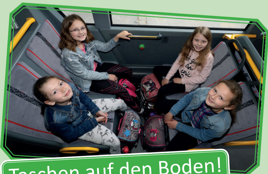
Taschen auf den Boden!