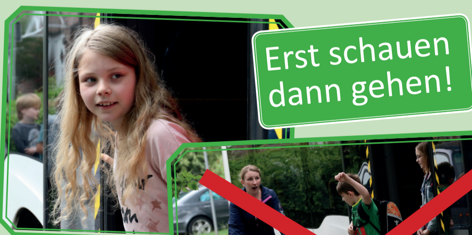
Erst schauen dann gehen!