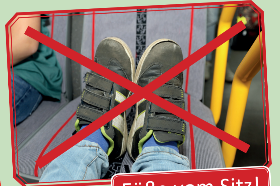
Füße vom Sitz!